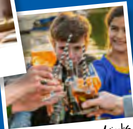
Cocktails & Longdrinks