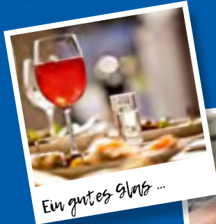
Ein gutes Glas ...